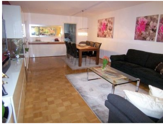
Wohnzimmer Ansicht 2