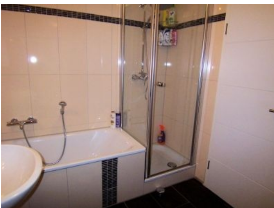
Bad Ansicht 2

Ob zu Zweit oder mit Kind, ob Jung oder etwas Älter ---- hier kann sich jeder wohlfühlen. Hier erwartet Sie eine sehr schöne Eigentumswohnung in einem sehr gepflegten Haus. Die gut aufgeteilte Wohnung mit Südbalkon befindet sich im 2. OG, zu erreichen über das Treppenhaus sowie bequem mit dem vorhandenen Aufzug. 2011 wurde die Küche und die Diele neu gefliest, alle Türen ausgetauscht sowie das Bad und GWC modernisiert. Zur Wohnung gehört eine Garage mit direktem Zugang zum Haus.