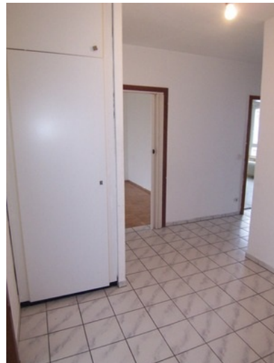
Diele mit Einbauschränk