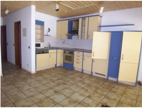
Küche Ansicht 2