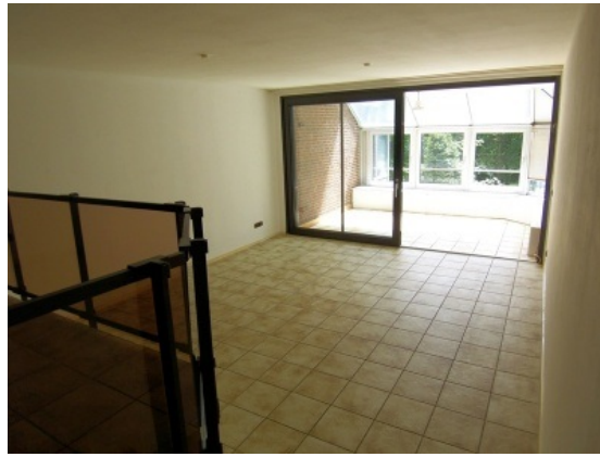
Wohnzimmer mit Wintergarten