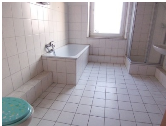
Bad 2. OG