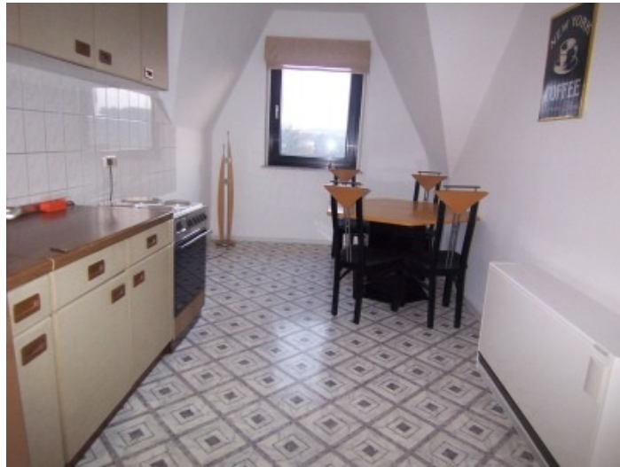
Küche 3. OG