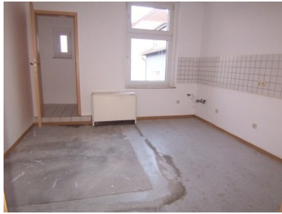
Küche m. Abstellraum 2. OG