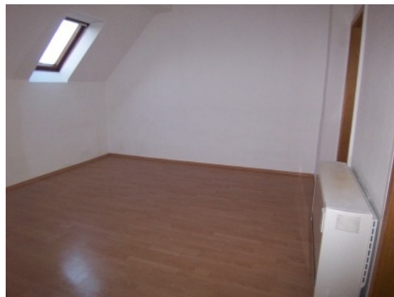
Wohnzimmer 3. OG