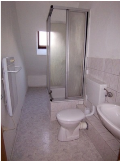
Bad 3. OG