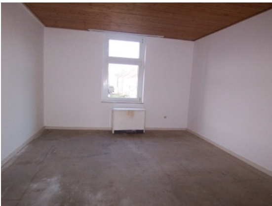
Schlafzimmer 2. OG

Hier bieten wir Ihnen eine günstige Immobilie mit 3 Wohnungen und 1 Gewerbe (Kiosk) an. Zwei Wohnungen sind nach und nach renoviert worden. Die Wohnungen im 2. OG sowie im 3. OG sind frei, die Wohnung im 1. OG sowie das Gewerbe sind vermietet.