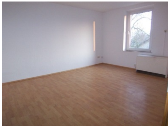
Wohnzimmer 2. OG