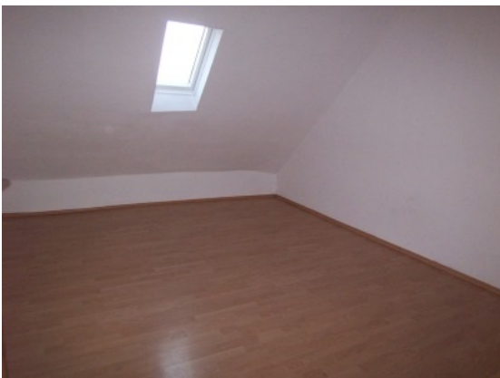
Schlafzimmer 3. OG

Im 1. OG Gasetagenheizung, sonst Nachtspeicherheizung