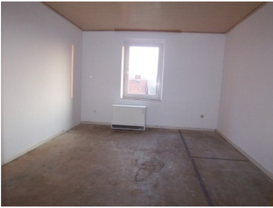
Kinderzimmer 2. OG